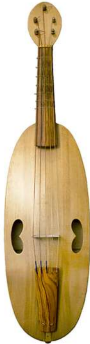
Arriba: Viola medieval.