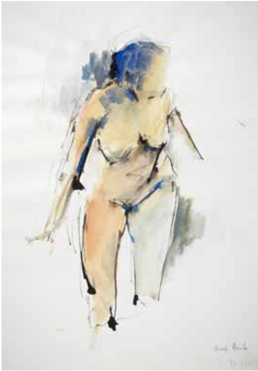
Apunte Tinta y t mpera sobre papel 2017 42 x 30 cm