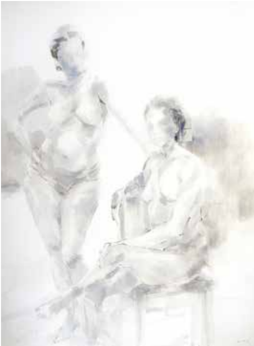
El ensayo general Tinta sobre papel 2017 162 x 122 cm