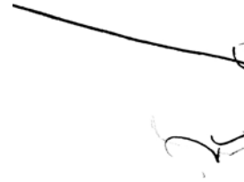
Apunte (det.) Tinta sobre papel 2017

Son numerosas sus proyectos expositivos colectivos e individuales, destacan los siguientes proyectos: Panelaky (2000) y Mundo real, mundo imaginario (2002) en Bratislava y Viena; Dibujos (2006), Mar y Arena I y II (2009 y 2013) y Dibujos y Pintura (2015) de la mano de la Galería Chys de Murcia; Contorno real, alma imaginaria (2012) en la Sala Mejía Lequerica de Madrid; Diálogos con Ramón Gaya (2014) en el Museo Ramón Gaya; Eva. Dibujos y collages (2015) en la Galería Gigarpe de Cartagena; entre otras.