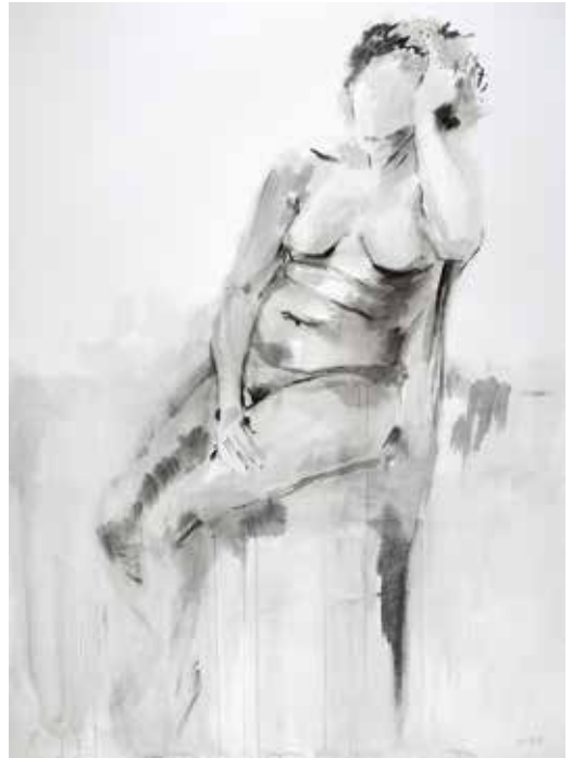
Mujer sentada Tinta sobre papel 2017 130 x 97 cm