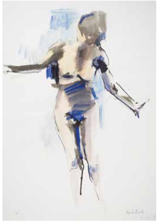
Apunte Tinta y t mpera sobre papel 2017 42 x 30 cm