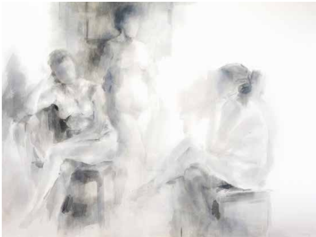
El camerino Tinta sobre papel 2017 122 x 162 cm